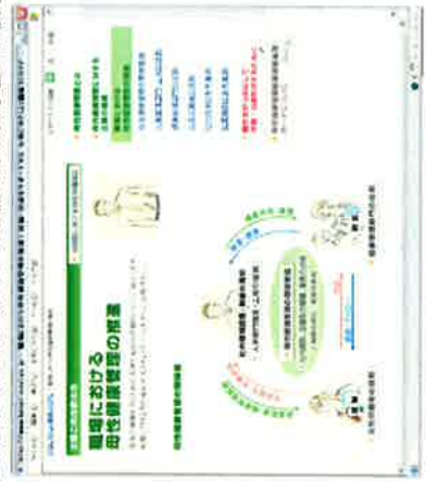
【母性健康管理関係者の役割を解説】

さらに、チェックリストで自社の母性健康管理に関する取組の進捗度合いについて確認することができます。