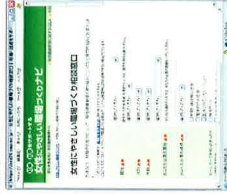
【相談窓口の問い合わせフォーム】