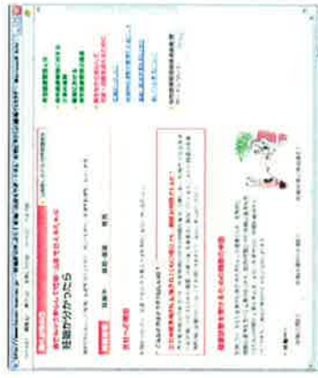
【各解説の「こんなときどうすればいいの？」】