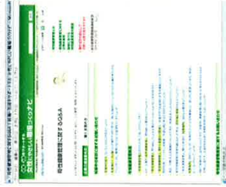
【母性健康管理に関するQ&A】

また、母性健康管理制度を推進する企業や、対象となる女性労働者のさまざまな疑問やお悩みや悩みに迅速に対応するために、サイトに相談窓口を設け、メールによるサポートを実施します。