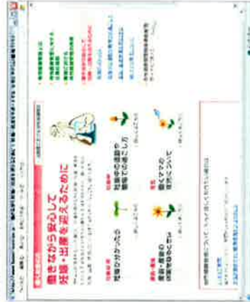
【妊娠～出産までのステップに応じた受けられる措置の解説】

また、具体的な職場での場面に応じたワンポイントアドバイス「こんなときどうすればいいの？」を設け、より実用的な情報提供をしています。