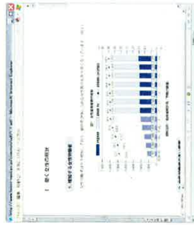
【詳細の資料は、pdfファイルでダウンロードが可能】